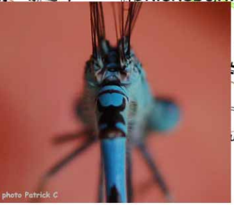
L'Agrion de Mercure: un vrai viking

Situé à 20 minutes au sud de Caen, le marais alcalin de Chicheboville-Bellengreville est un très bel exemple de milieux tourbeux alcalins. Sur près de 154 hectares, ce site classé Natura 2000 est reconnu pour la diversité de ces milieux humides préservés (cladiaie, tourbière basse alcaline, mégaphorbiaie, etc.). Il héberge notamment plusieurs espèces d'intérêts communautaires telles que l'Agrion de Mercure et le Vertigo étroit. (CEN Normandie)