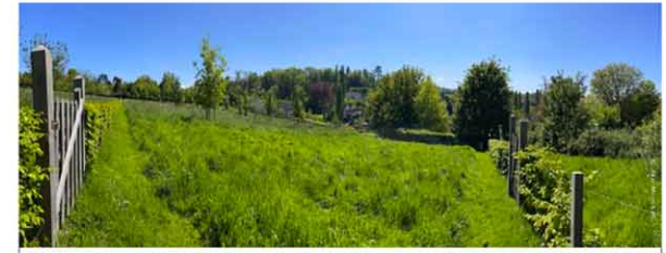
En contrebas de la mairie, le Clos Gunnulf est un espace aménagé. Une halle de type augeron a été construite, des tables de pique-nique installées, un rucher implanté. Un verger de 53 pommiers, un terrain de boules et des jeux pour les enfants complètent l'ensemble. Le tout est bordé d'une haie bocagère.

https://apiculturenaturelle.fr/les-ruchers-municipaux/le-rucher-commune-gonneville-sur-mer/