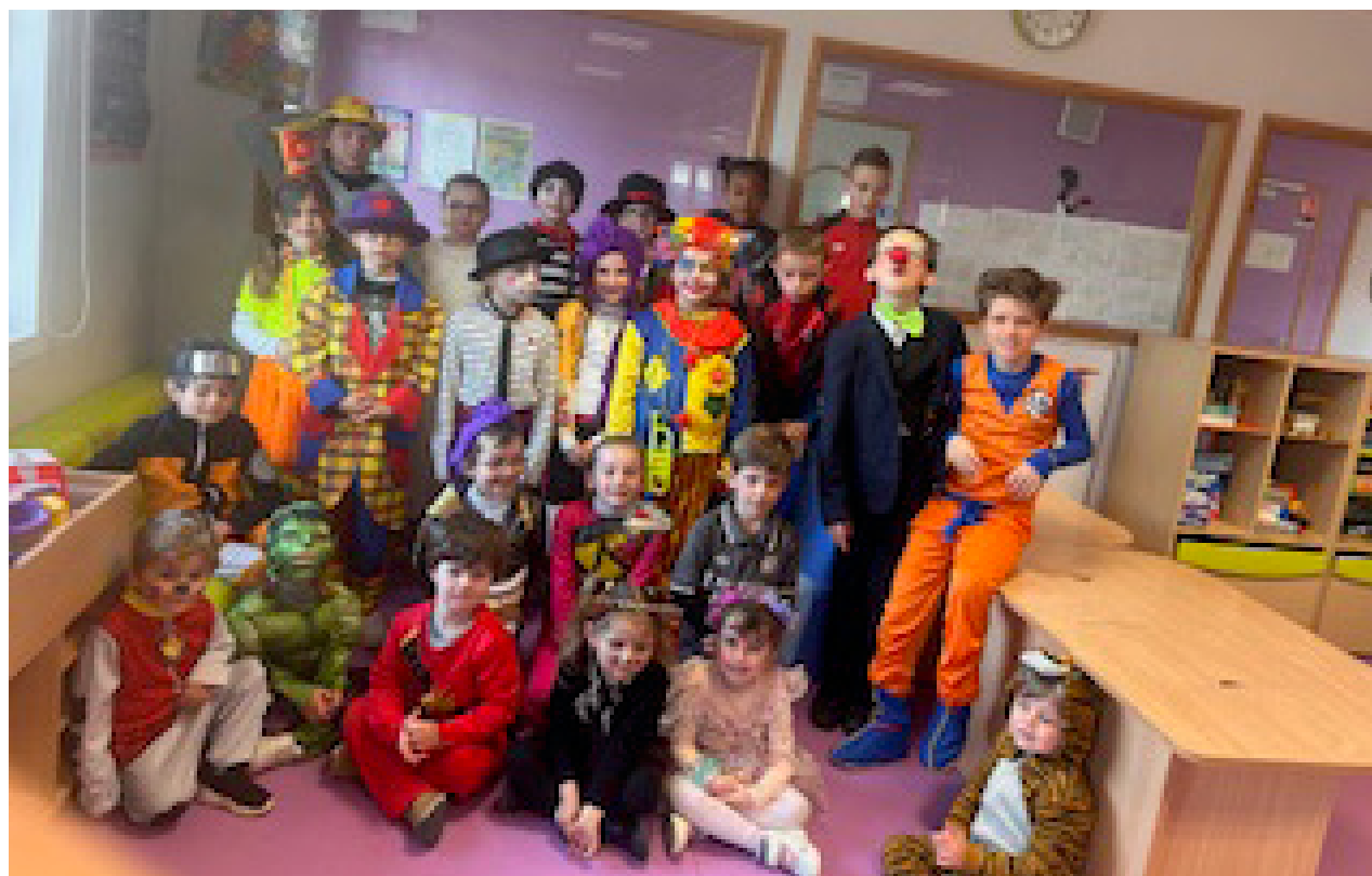
Garderie du matin Activité pixel et décorations pour la garderie. Nous avons également fêté le carnaval en garderie.