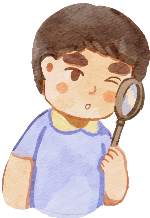
Zoom sur notre affiche pédagogique