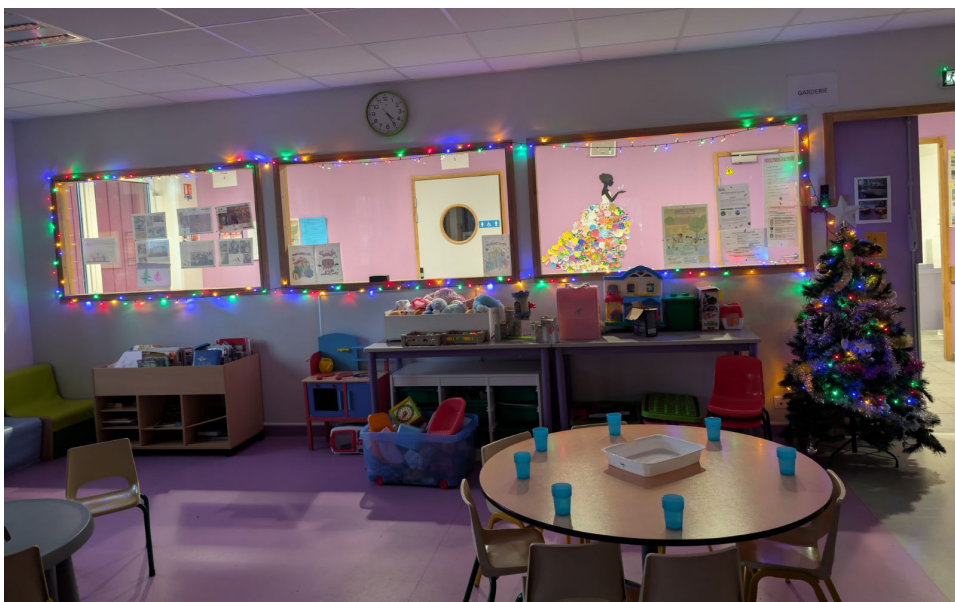
Décoration du sapin dans la cour avec l'APEC sur le temps de la garderie du soir