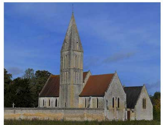
L'église Saint-Martin de Rosel

Situé le long de l'ancienne route de Bayeux, ce château, de style néo renaissance, a été construit entre 1854 et 1860 par Sophronyme Beaujour. Un mur de pierres extraites de la carrière du Lait bouilli, jadis située derrière le centre d'animation actuel, de près de 3 kilomètres entoure le parc de 35 hectares. (Ouest-France)