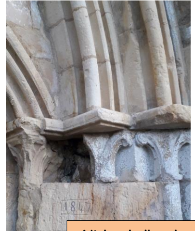
Niche de l'un des bienfaits de Saint-Clair