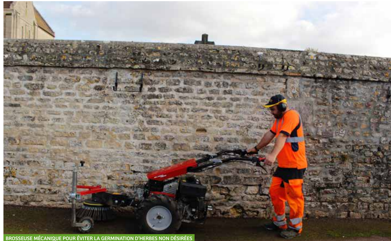
BROSSEUSE MÉCANIQUE POUR ÉVITER LA GERMINATION D'HERBES NON DÉSIRÉES

Depuis le 1 er janvier 2017, les communes n'ont plus le droit d'utiliser de produits pesticides pour entretenir les espaces verts publics. En 2019, ce sera au tour des particuliers. La bataille pour la santé et l'environnement est l'affaire de tous.