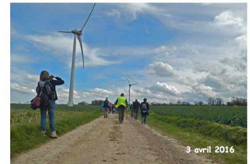
3 avril 2016

Le lavoir du XIXème siècle à Fontenay-le-Pesnel se déverse dans le Bordel: affluent de la Seulles de 10,9 km de long