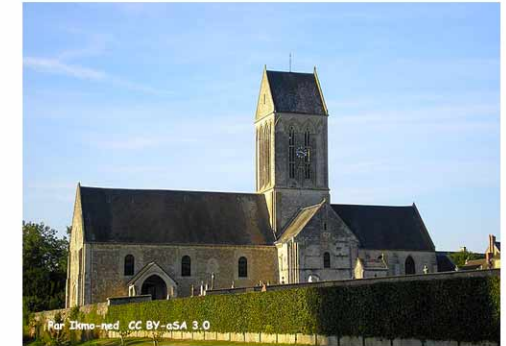
L'église Saint-Pierre de Tilly-sur-Seulles