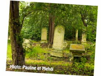
Le cimetière des Quatre-Nations Doit son nom au fait que l'on y inhumait des personnes avant vécu sur les quatre paroisses environnantes.