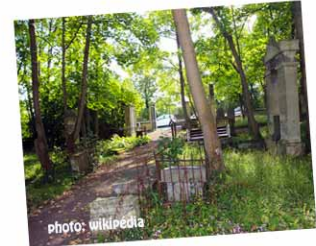
Le cimetière protestant Y est enterré Georges Brummell, dandy britannique.