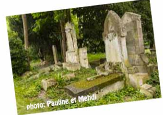
Le cimetière Saint-Pierre Gravé sur une pierre: «J'ai été ce que vous estes et vous serez ce que je suis»